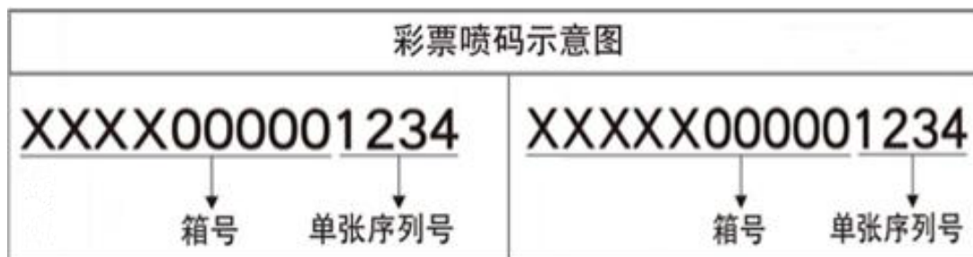
箱号含 4 位字母的序列号示意图

4.2 每张热敏纸均有唯一序列号，由 13 位或 14 位字母和数字组成。具体为：箱序列号（4 至 5 位字母+5 位数字）+张序列号（4 位数字）；采用宋体，分辨率 \geq 150\text{dpi} \times 150\text{dpi} 分辨率、字高为 3.0\text{mm} \pm 0.5\text{mm} ；颜色为黑色。示意如图 3 所示：