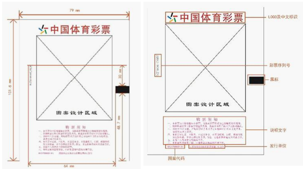
图 2 单张热敏纸印刷布局示意(装饰图案面)

3.6 识读标规格、位置符合设计要求。规格为 10.0mm (宽) \times 5.0mm (高)，规格偏差 \leq 0.1 mm; 裁切后位置纵向距底边 48.7mm \pm 1.0mm, 横向距右侧纸边 1.0 mm \pm 0.5 mm; 黑密度值 D \geq 1.00 。单张热敏纸印刷内容布局如图 2 所示: